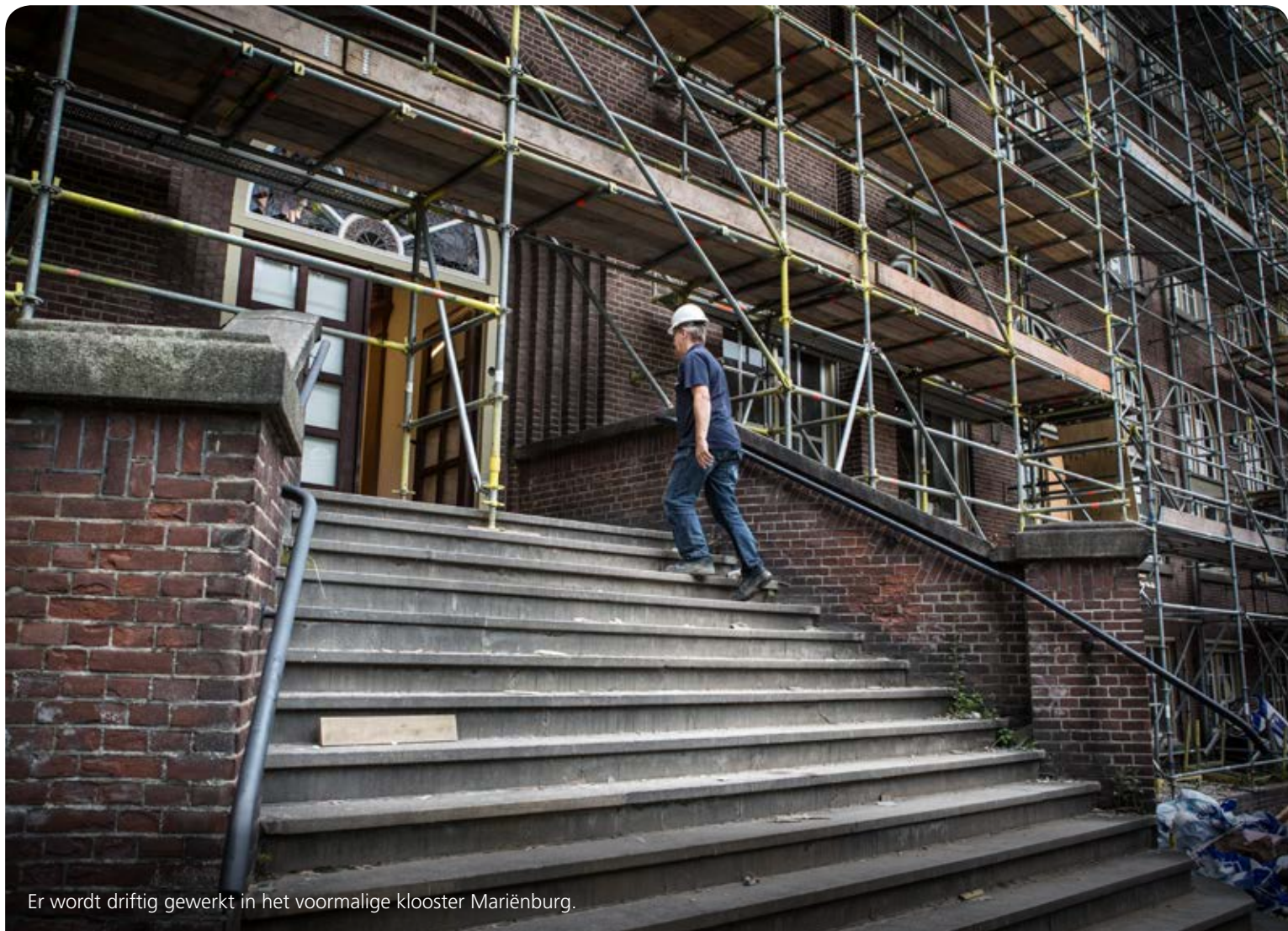
Er wordt driftig gewerkt in het voormalige klooster Mariënburg.