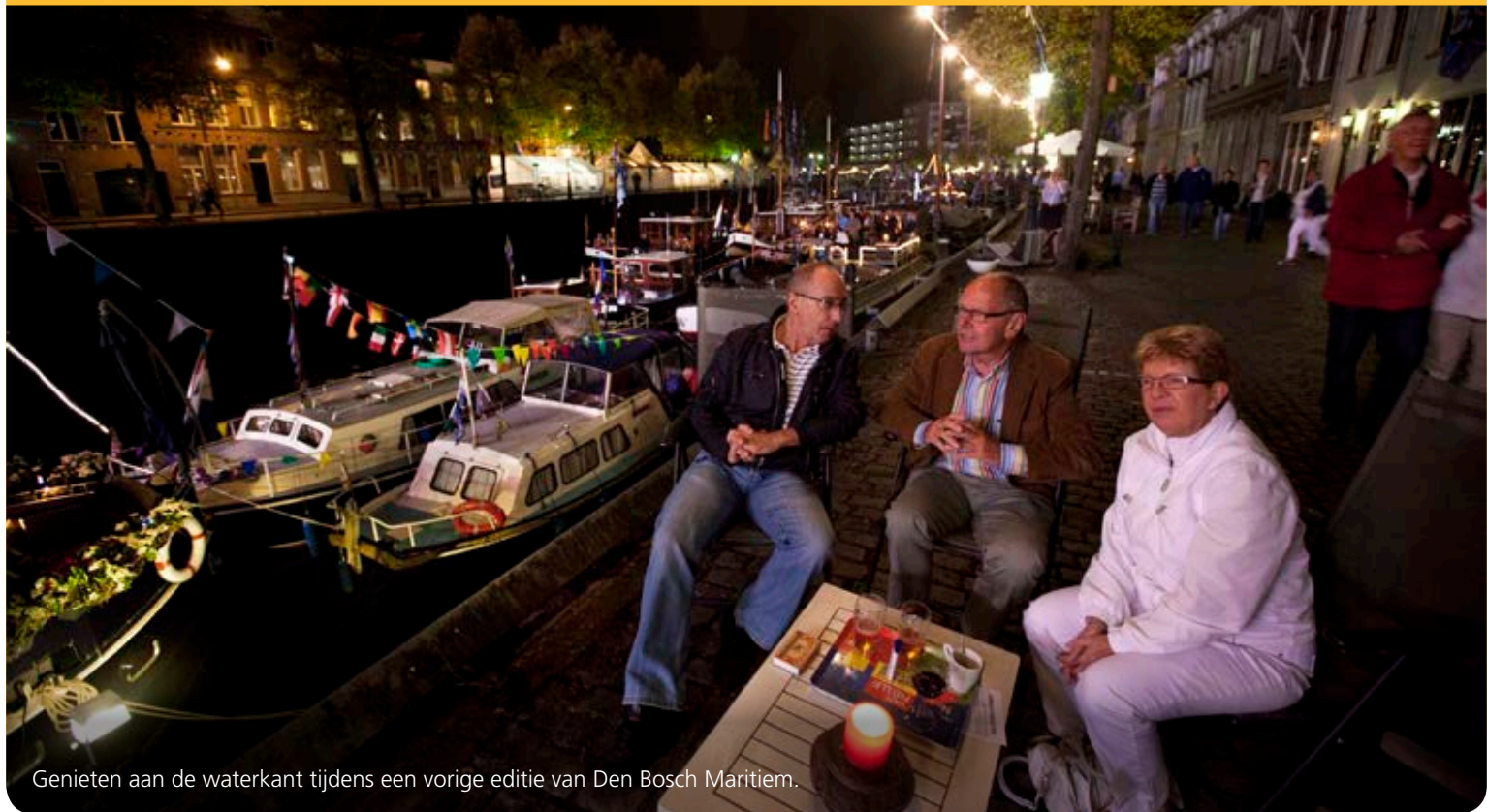
Genieten aan de waterkant tijdens een vorige editie van Den Bosch Maritiem.

De organisatie verwacht ongeveer 100.000 bezoekers. En dat betekent nogal wat voor de bewoners van de binnenstad. Die zijn inmiddels wel wat gewend, maar Blb/wijkraad Binnenstad volgt de week kritisch. Overigens is door de gemeente het aantal evenementen in de binnenstad aan een maximum verbonden.