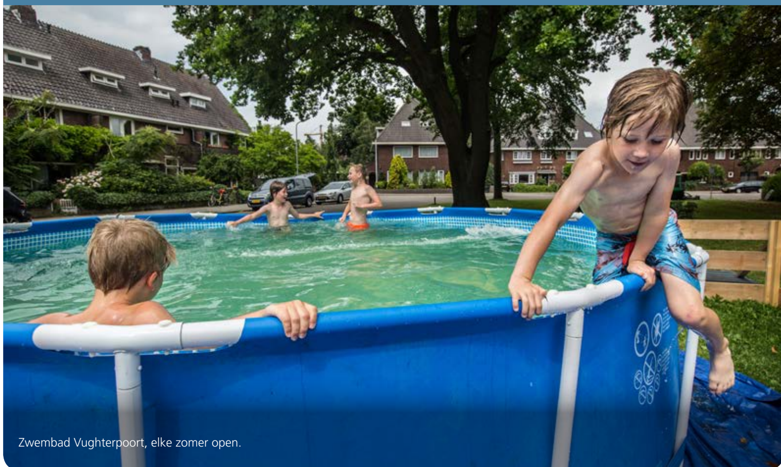
Zwembad Vughterpoort, elke zomer open.

want dan zetten we er wat tuinstoelen bij en schenken een glaasje in. Tegen de tijd dat de meeste buurtbewoners op vakantie gaan, breken we de boel weer af."