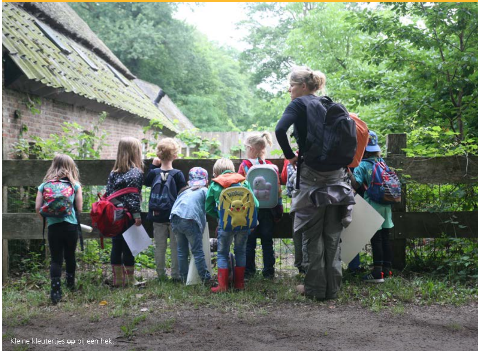
Kleine kleurtertjes op bij een hek.

Les geven in de openlucht en dan bij voorkeur in de natuur – steeds meer leerkrachten, ouders en kinderen worden er enthousiast van. De groepen 1 en 2 van de Beekmanschool probeerden het vijf dinsdagen uit.