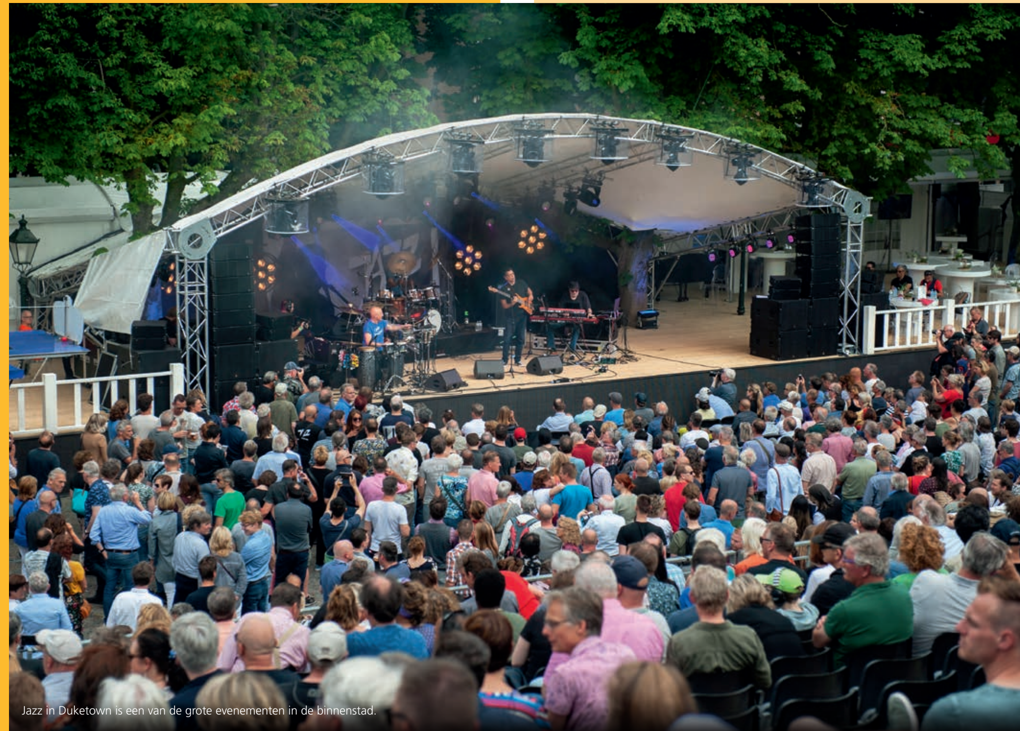
Jazz in Duketown is een van de grote evenementen in de binnenstad.