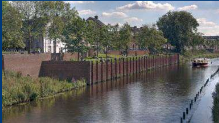
Voorbeelden in de vestingrand Bastion Maria Bolwerk Sint Jan