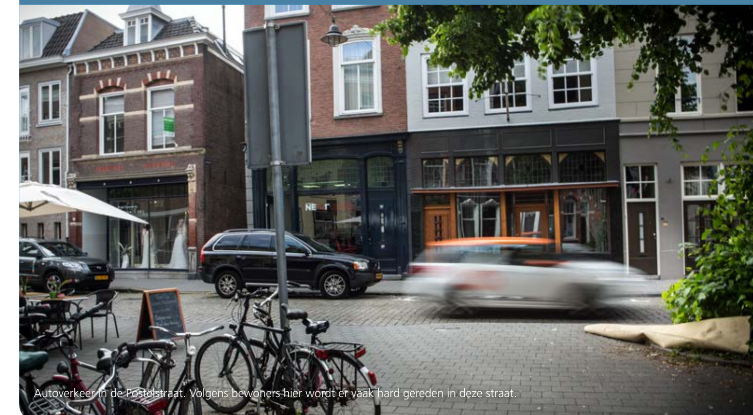
Autoverkeer in de Postelstraat. Volgens bewoners hier wordt er vaak hard gereden in deze straat.

Er wordt in sommige straten in de binnenstad te hard gereden, zoals in de Postelstraat. Tijdens de algemene vergadering van Blb wijkraad Binnenstad van afgelopen maart ging het erover. Zie verderop in deze nieuwsbrief het artikel 'Applaus voor Monica'.