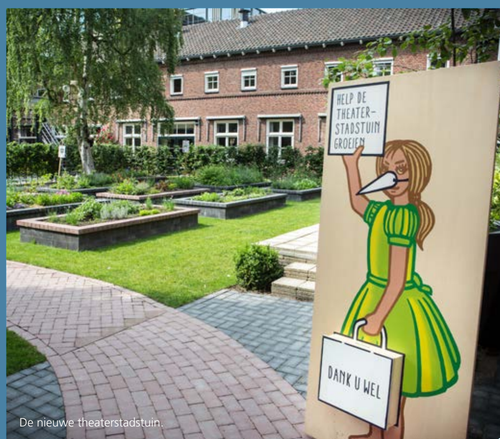
De nieuwe theaterstadstuin.

Voor wie zich afvraagt waarom de stadstuin in de volksmond kloostertuin wordt genoemd: ooit was dit de tuin van het klooster Sint Martha. Het klooster dateert in haar huidige vorm van 1949. De laatste religieuzen verlieten het gebouw in 2000. Sindsdien is het gebouw eigendom van het Liliane Fonds.