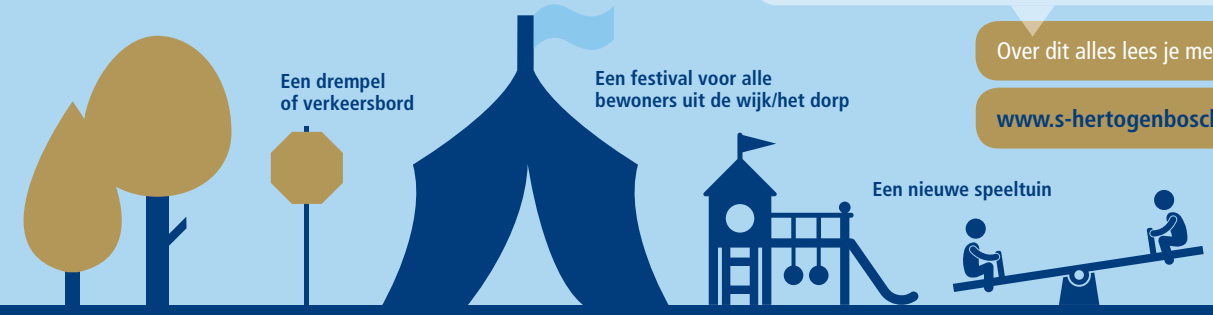
Een drempel of verkeersbord