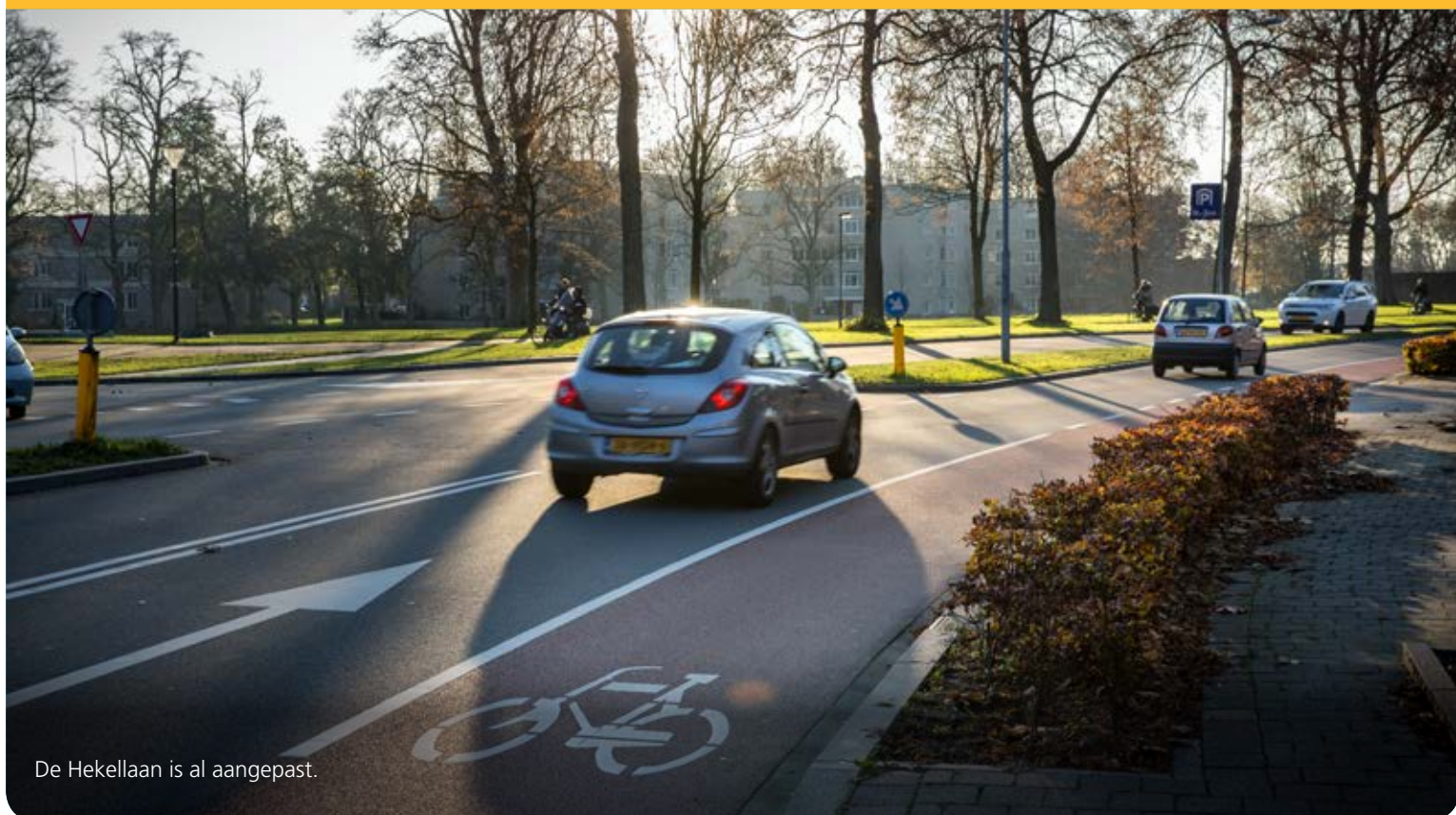
De Hekellaan is al aangepast.