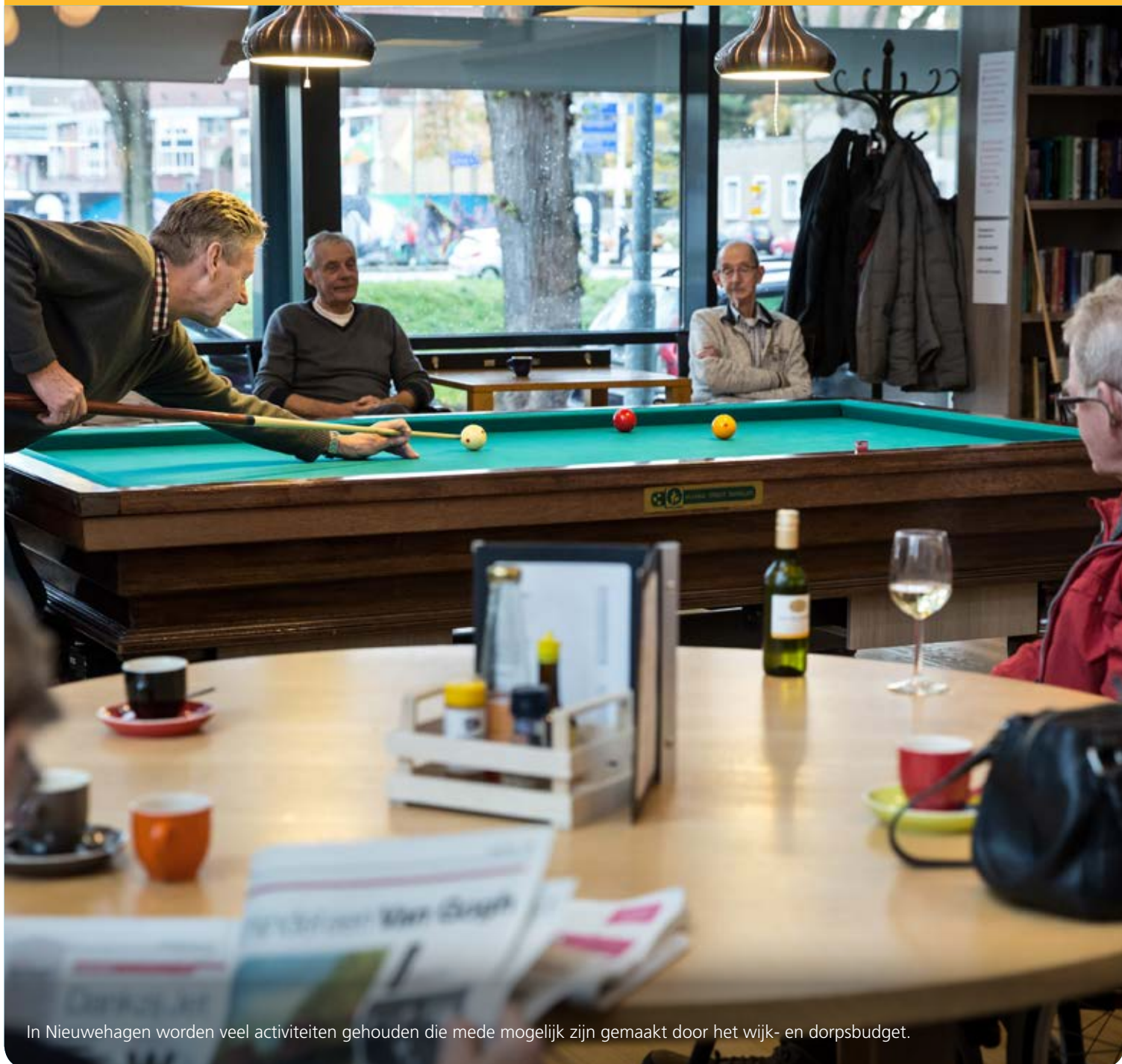
In Nieuwehagen worden veel activiteiten gehouden die mede mogelijk zijn gemaakt door het wijk- en dorpsbudget.

Andere verzoeken zijn dan weer heel snel goedgekeurd. Zoals die van de dansmiddag, die elk jaar wordt gehouden voor de bewoners van de Nederveenflat. Doel is om bewoners uit hun isolement te halen. Dat lukt aardig, bij een vorige editie waren er meer dan tachtig senioren van de partij. De organisator weet exact wat het kost, want vraagt € 768 aan. Dat is exclusief eten en drinken. De aanvrager laat weten dat de deelnemers dat zelf betalen.