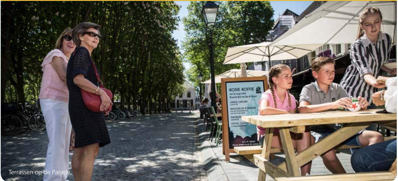
Terrassen op de Parade.

Maar natuurlijk kon dat. De terrassen zijn helemaal nieuw en de rijbaan is vervangen door granieten keitjes.