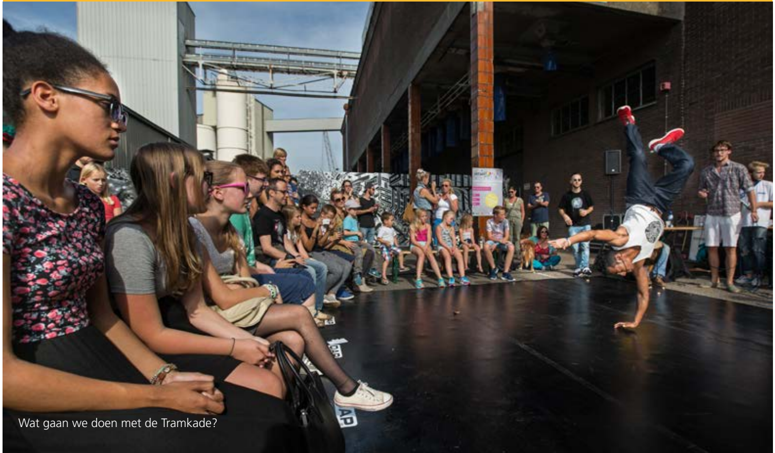
Wat gaan we doen met de Tramkade?

Bewoners van de buurt Het Zand worden nadrukkelijk betrokken bij de ontwikkeling van de Spoorzone. De gemeente heeft grote plannen met dit stadsdeel, waarvan Het Zand een onderdeel is.