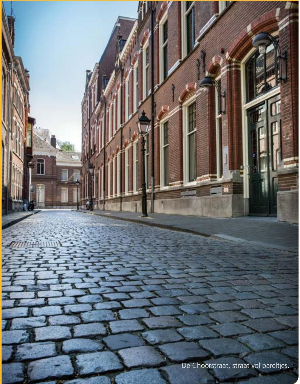
De Choorstraat, straat vol pareltjes.