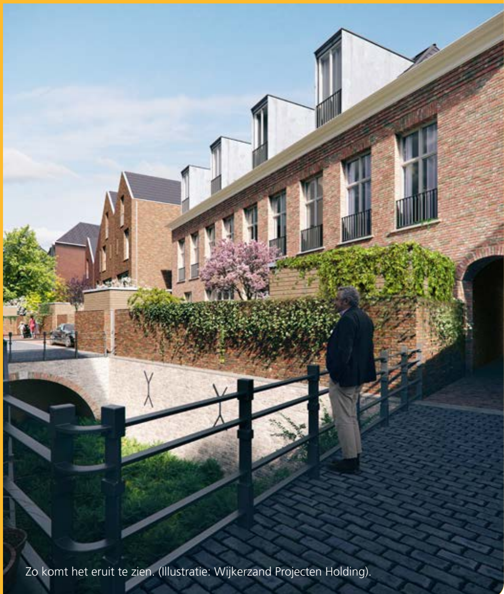
Zo komt het eruit te zien. (Illustratie: Wijkersand Projecten Holding).

De verkoop van de woningen is in volle gang. Met de bouw wordt komend najaar begonnen.