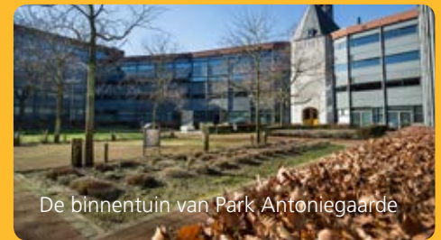
De binnentuin van Park Antoniegaarde

En een broodje kunt u er ook eten. Met dank aan Anthonius.