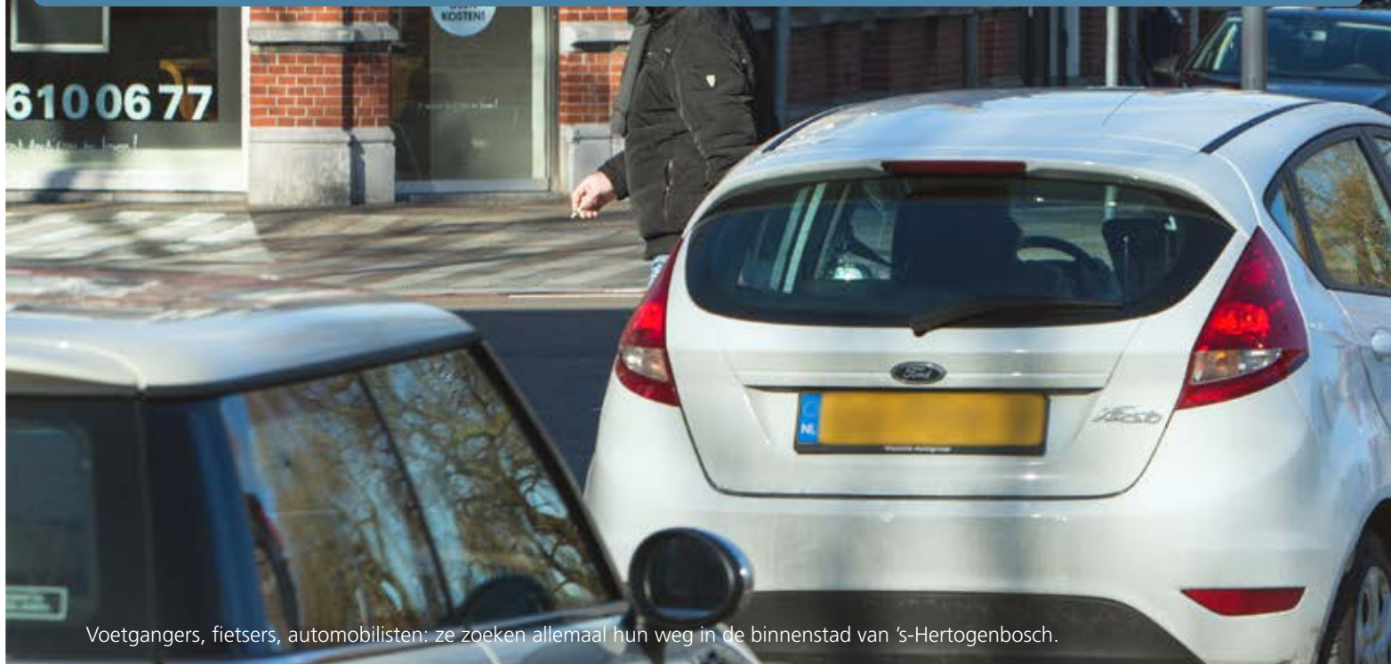
Voetgangers, fietsers, automobilisten: ze zoeken allemaal hun weg in de binnenstad van 's-Hertogenbosch.