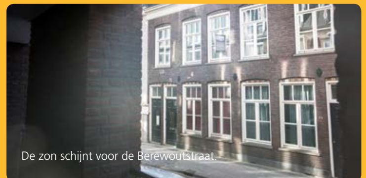
De zon schijnt voor de Berewoutstraat.

Als het u wat lijkt, dan heeft u pech. De makelaar heeft de huizen, ontworpen door Kuin&Kuin ('s-Hertogenbosch) en gebouwd door aannemer en projectontwikkelaar Hoedemakers (Rosmalen) al verkocht. Dat geldt ook voor het hoofdhuus, dat er al stond voor de bouw en mocht blijven staan. Die woning werd gebruikt als bouwkeet en wordt de komende maanden stevig verbouwd.