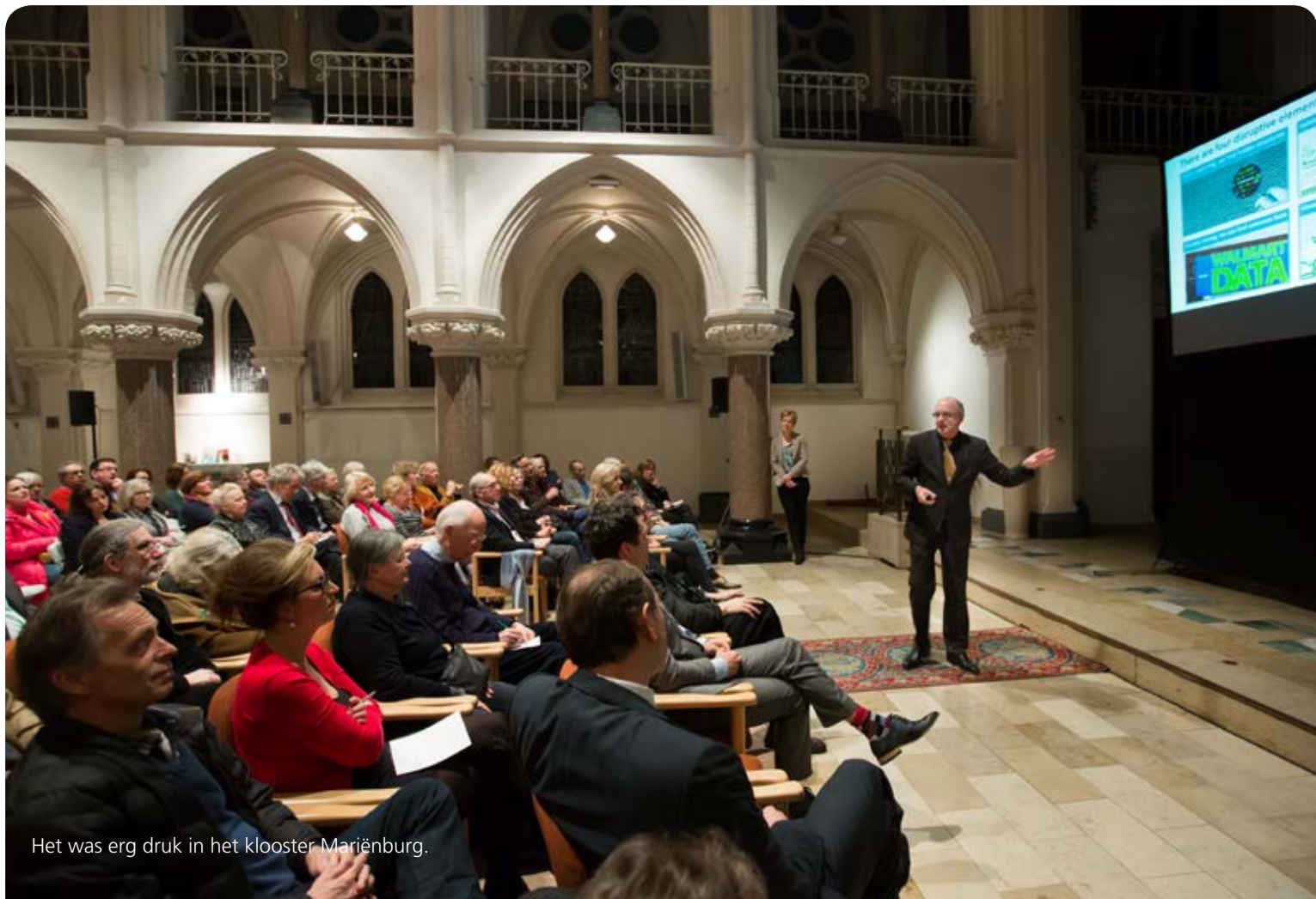
Het was erg druk in het klooster Mariënburg.